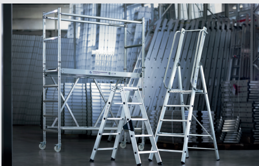
MUNK Günstzburger Steigtechnik

Die MUNK Günstzburger Steigtechnik ist eine Marke der MUNK Group und steht für Leitern, Rollgerüste und Sonderkonstruktionen in Premium-Qualität.