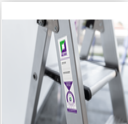
Bestell-Nr.: 019176 Inventaraufkleber