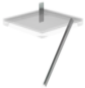
Bestell-Nr.: 060953 Flanschplatte und Strebe für Ziegelmauerwerk, Tiefe 1000mm