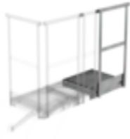
Bestell-Nr.: 060943 Erweiterungspodest