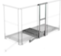
Bestell-Nr.: 060952 Erweiterungspodest