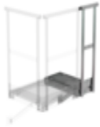
Bestell-Nr.: 060941 Erweiterungspodest