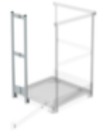
Bestell-Nr.: 060957 Geländerelement