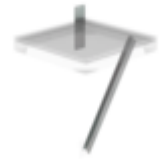
Bestell-Nr.: 060954 Flanschplatte und Strebe für Ziegelmauerwerk, Tiefe 800mm