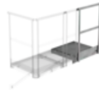
Bestell-Nr.: 060951 Erweiterungspodest