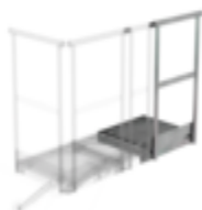
Plate-forme d'extension 400 x 800 mm