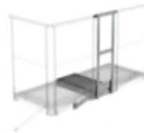
Plate-forme d'extension 1000 x 1000 mm