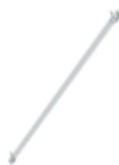
Planche de bordure latérale pour longueur d'échafaudage 1,8 m