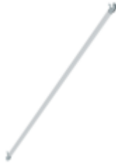
Planche de bordure latérale pour longueur d'échafaudage 2,45 m