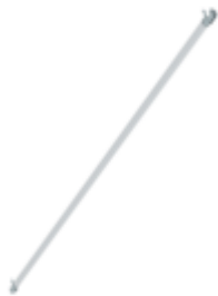
Planche de bordure latérale pour longueur d'échafaudage 3,0 m