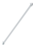
Planche de bordure latérale pour longueur d'échafaudage 1,8 m