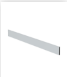
Planche de bordure latérale pour longueur d'échafaudage 2,45 m