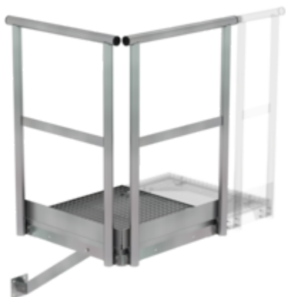
Plate-forme de base 800 x 800 mm