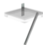
Plate-forme d'extension 1000 x 1000 mm