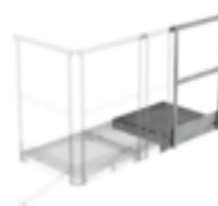
Plate-forme d'extension 500 x 1000 mm