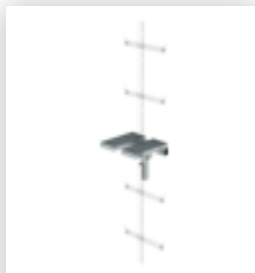
Plate-forme de repos rabattable à monter sur une échelle à un montant Acier inoxydable