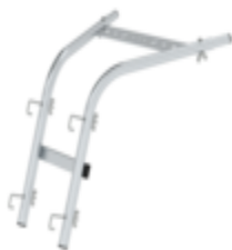
Plate-forme à suspendre R13 pour échelles à barreaux RAL 1021