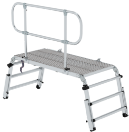
Plate-forme de travail et de secours Premium