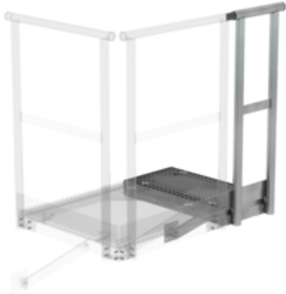
Plate-forme d'extension 400 x 800 mm