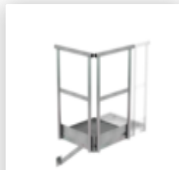
Plate-forme d'extension 500 x 1000 mm