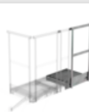
Plate-forme d'extension 400 x 800 mm