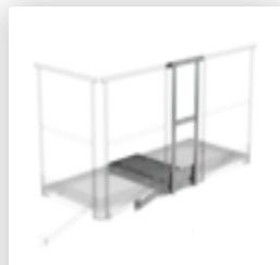
Plate-forme d'extension 1000 x 1000 mm