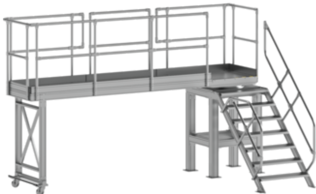
Plate-forme de travail à couronne d'orientation