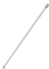
Planche de bordure latérale