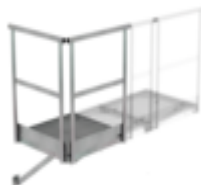
Plate-forme de base 800 x 800 mm