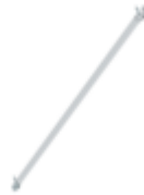
Planche de bordure latérale