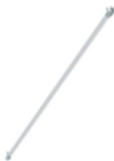
Planche de bordure latérale