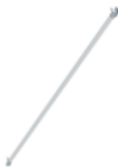
Planche de bordure latérale