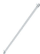
Planche de bordure latérale