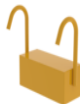
Plate-forme sans trappe