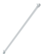
Planche de bordure latérale